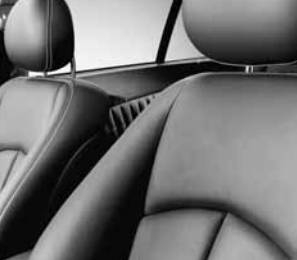
Sportliche Sitzanlage ▲