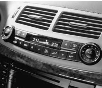
◀ Klimaanlage »THERMOTRONIC«