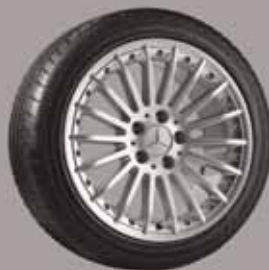
◀ Markab, Mehr-Speichen-Design