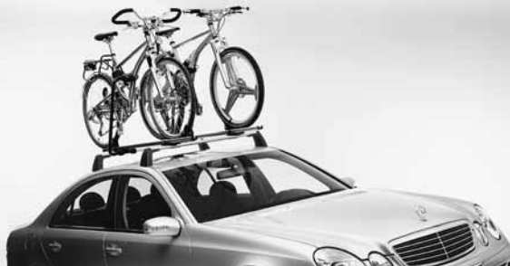
◀ Grundträger Alustyle, Fahrradhalter New Alustyle