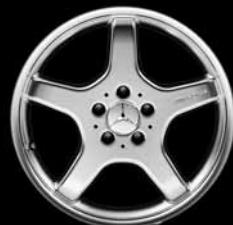
▼ 5-Speichen-Design AMG