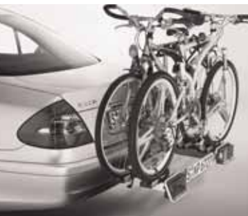
◀ Heckfahrradträger für Anhängvorrichtung