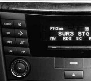
Radio Audio 20 CD ▼