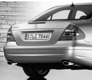
Heckansicht Sportpaket AMG ▲