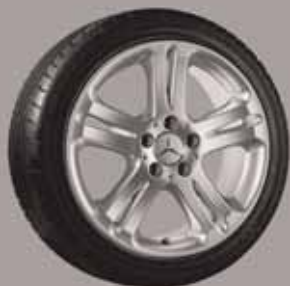
◀ Almach, 5-Doppelspeichen-Design