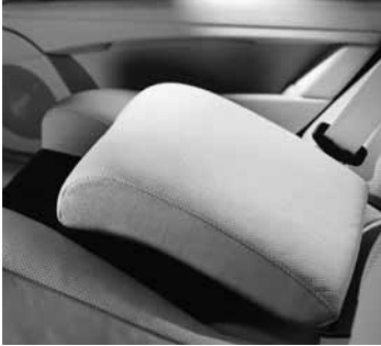
◀ Fondsitze mit Kindersitz