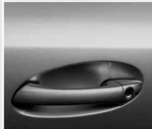
▲ Türgriffe lackiert