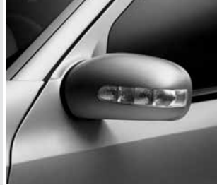
▲ Außenspiegel mit Blinkleuchte