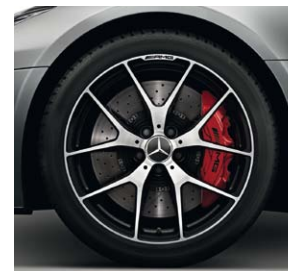
48,3 cm (19")/50,8 cm (20") AMG Schmiederäder im Kreuzspeichen- Design (697)