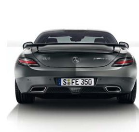
Heckansicht Final Edition