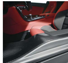
AMG Carbon-Paket Interieur