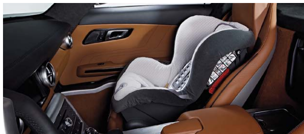
Kindersitz DUO plus