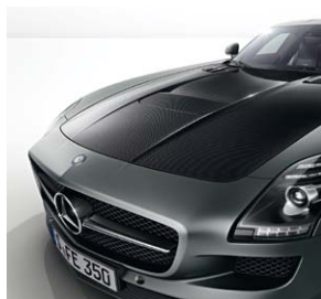
Motorhaube in Sichtcarbon