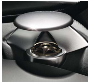
Hochtöner Bang & Olufsen BeoSound AMG