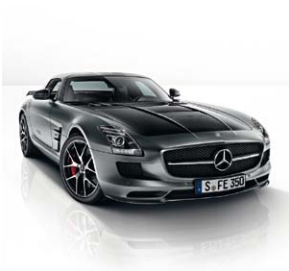
Frontansicht FINAL EDITION