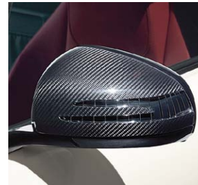
AMG Carbon Außenspiegel