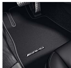
AMG Fußmatten schwarz mit Ledereinfassung in Silber