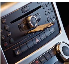
PCMCIA Multi-Card Reader mit SD-Karte