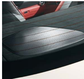
250-Watt-Subwoofer, Bang & Olufsen BeoSound AMG