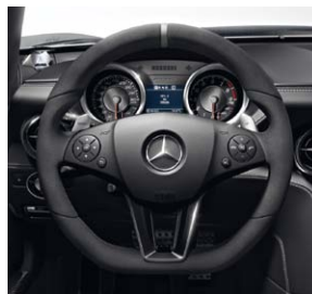
AMG Performance Lenkrad