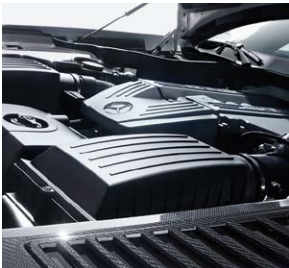
AMG Carbon Motorraumabdeckung