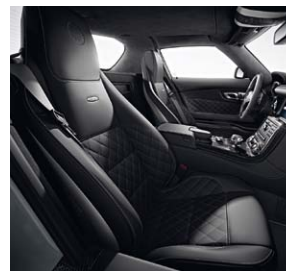
designo Leder Exklusiv mit Rauten Design