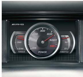
AMG Performance Media