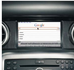
AMG Performance Media