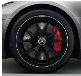
48,3 cm (19") / 50,8 cm (20") AMG Schmiederäder im Kreuzspeichen-Design (699)