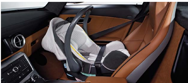
Kindersitz BabySafe plus