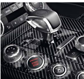
Plakette »FINAL EDITION - 1 of 350«