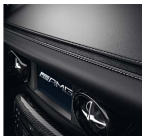
»3D-Naht« in Alcantara® mit Kontrastziernähten in Silber