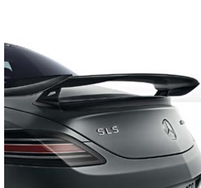
Heckflügel aus Carbon