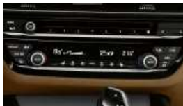
Sitzheizung für Fahrer und Beifahrer (S0494)