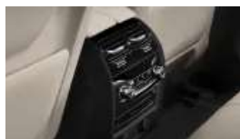
Klimaautomatik mit 4-Zonenregelung (S04NB)