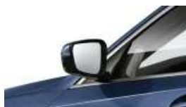
Erweitertes Außenspiegelpaket (S04T8)