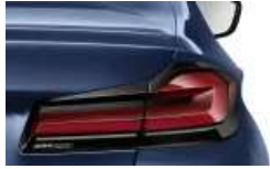
Modellschriftzug Entfall (S0320)