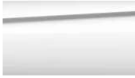
Alpinweiß uni ( P0300 ) 0 €