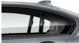
M Hochglanz Shadow Line (S0760)