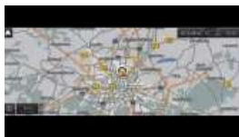
BMW Live Cockpit Professional (S06U3)