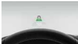
BMW Head-Up Display (S0610)