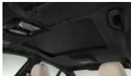
M Dachhimmel anthrazit (S0775)