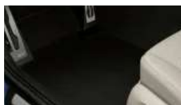
Fußmatten in Velours (S0423)