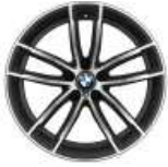
18" M LMR Doppelspeiche 662 M ( S027P ) 0 €