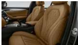
Sportsitze für Fahrer und Beifahrer (S0481)