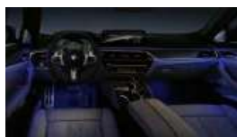
Ambientes Licht (S04UR)