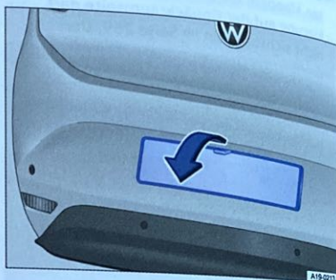
Abb. 128 Kennzeichenträger herunterklappen.

📖 Beachten Sie ⚠️ zu Beginn dieses Kapitels auf Seite 260.