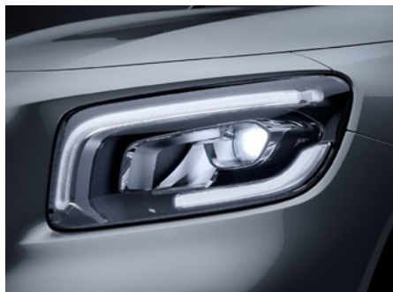
LED High Performance-Scheinwerfer

Die beheizte Scheibenwaschanlage sorgt für freien Durchblick und unterstützt somit eine sichere Fahrt auch bei kalten Temperaturen. Sie kann unter anderem das im Winter typische Vereisen verhindern. So können Sie Ihre Frontscheibe möglichst optimal reinigen.