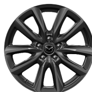
18-Zoll Leichtmetall Grau