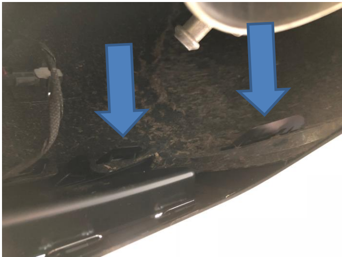
Clipse in der Verlängerung