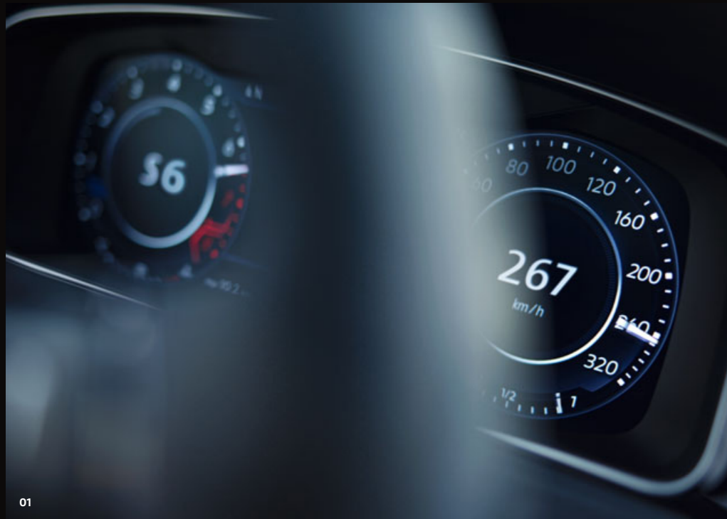
01 Durch die Aufhebung der Geschwindigkeitsbegrenzung von 250 km/h erreichen Sie mit Ihrem neuen Golf R oder Golf R Variant Spitzengeschwindigkeiten von bis zu 267 km/h 2) . SO

Noch markiger, noch kompromissloser, noch durchsetzungsstärker: Mit dem optionalen „Performance“-Paket von Volkswagen R 1) können Sie aus Ihrem neuen Golf R oder Golf R Variant sogar noch mehr herauskitzeln.