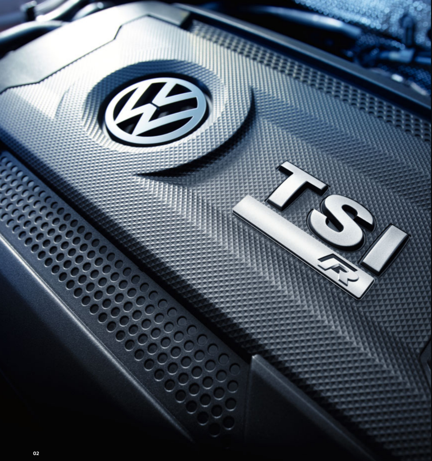
02 Das Herzstück des stärksten Golf R und Golf R Variant aller Zeiten ist der Motor mit TSI-Turbocharger-Technik. Das 228 kW (310 PS) starke Aggregat wartet unter der Abdeckung mit „R“-Badge darauf, seine ganze Power zu entfalten. Und das wird häufiger passieren, denn die Kombination aus Direkteinspritzung und intelligenter Turboaufladung sorgt für atemberaubende Fahrerlebnisse. S