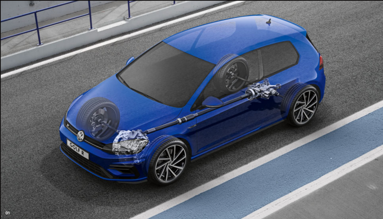
01 Die elektronisch gesteuerte Allradkupplung sorgt bei 4MOTION für die variable Verteilung der Antriebskraft zwischen Vorder- und Hinterachse. Ihre stufenlose Verstellung wird von einem Steuergerät geregelt, das den jeweiligen Schlupf, die fahrdynamischen Zustände und die Antriebsmomente berücksichtigt. S

Mit dem permanenten Allradantrieb 4MOTION werden die 228 kW (310 PS) des TSI-Motors bedarfsgerecht auf alle vier Räder verteilt. In Kombination mit dem neuen 7-Gang-Doppelkupplungsgetriebe DSG, das innerhalb weniger Hundertstelsekunden von einem Gang in den anderen schaltet, beschleunigen der neue Golf R und Golf R Variant effizient und ohne Zugkraftverlust.