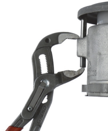
Abb.3: Einstellen der Kerbstifte