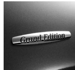
Plakette mit Logo »Grand Edition« auf Kotflügel vorne