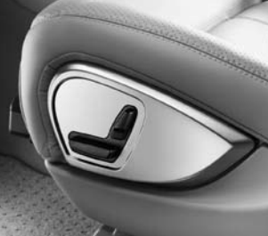
Vordersitze elektrisch verstellbar