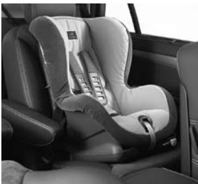
Kindersitz DUO plus