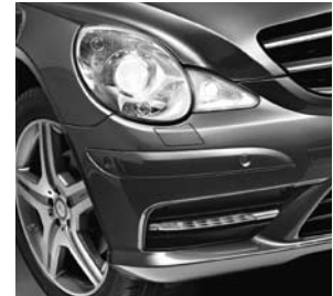
Bi-Xenon-Scheinwerfer mit Abbiegelicht und LED-Tagfahrlicht