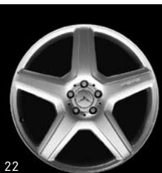
21" AMG 5-Speichen-Design