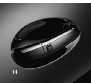
Türgriffe mit Chromeinleger