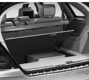
Staufach im Kofferraumboden