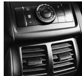
Komfort-Klimaanlage im Fond