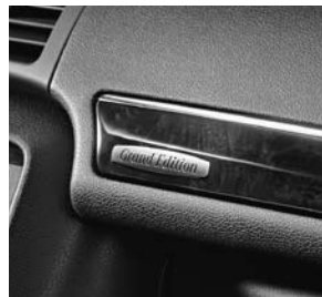
Plakette mit Logo »Grand Edition« in Holzzierteil auf Beifahrerseite