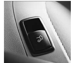
Heckklappe (automatisches Öffnen/Schließen)