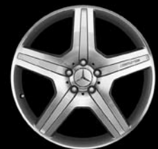
20" AMG 5-Speichen-Design