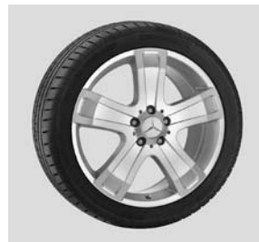
19" Sadalmelik, 5-Speichen-Design