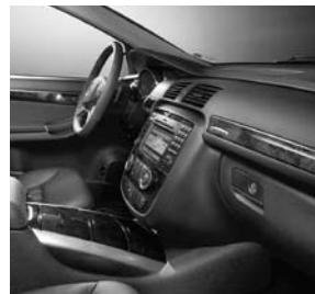
Zierteile in Holzausführung Pappel anthrazit mit Chromapplikation