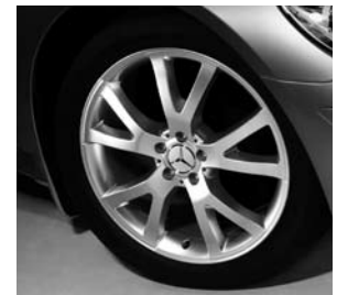
20" Alanz, 5-Doppelspeichen-Design