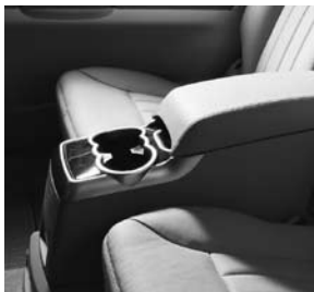
Mittelkonsole 2. Sitzreihe (nur für 4+2-Sitzer)