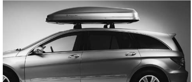
Grundträger New Alustyle, Mercedes-Benz Dachbox