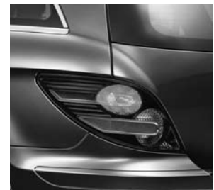
Rückleuchten in Sportoptik dunkel