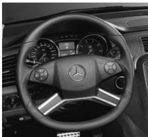
AMG Sportlenkrad mit Lenkrad-Schalt paddles