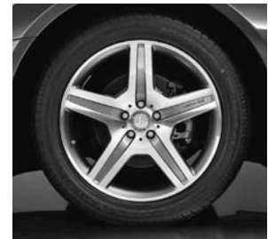
20" AMG Leichtmetallrad 5-Speichen-Design