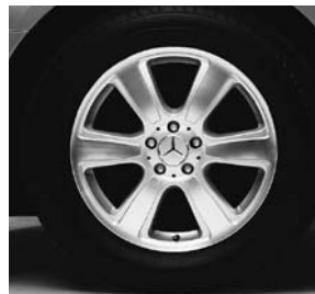
18" Angetenar, 6-Speichen-Design