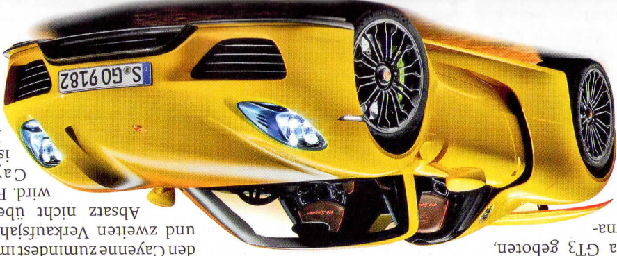
Porsche 918 Spyder: Geballte Leistung zum stolzen Preis.

nur wird das Dach in einer sehr aufwendigen Konstruktion elektrisch hinter den Vorderstutzen versenkt. Dafür muss der 911-Fahrer jedoch auf die sonst üblichen Ebenfalls Anfang des Jahres begünstigt Porsche mit der Auslieferung der ersten 918 Spyder. Das ist Rekord in unserer Historie – das wäre selbst für einen Konzern wie Volkswagen oder Toyota ein strammes Programm. „Das ist Rekord in unserer 65-jährigen Firmengeschichte“, sagt Porsche-Vorstandschef Ferdinand Piëch. Auch stellers unterstreichen. Bereits für 2014 geben die Zuffenhausener weiter Vollgas. Das Jahr beginnt mit dem Debüt des 911 Targa in Detroit, der im Frühjahr in den Handel kommt. Bei diesem Modell kehren die Porsche-Entwickler zu Altbewährtem zurück. In den Anfängen der 911er-Baureihe (ab 1965) ließ sich das Hardtop-Dach als festes Teil herausnehmen. Überrollbügel und die Panoramaher Heckschleibe blieben stehen. Ähnlich läuft es auch jetzt ab.