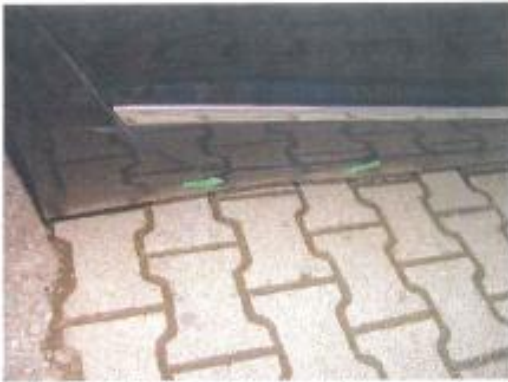
Anstoß Seitenschweller hinten rechts