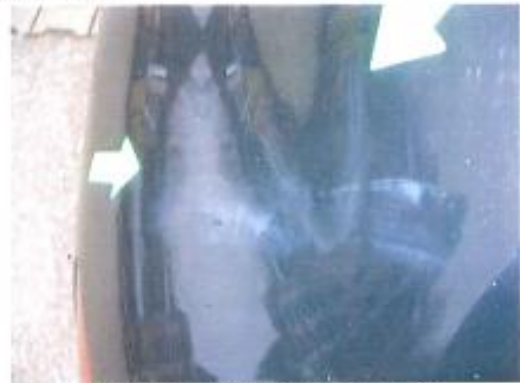
matte Lackstelle C-Säule links