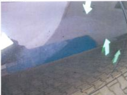
matte Lackstelle Türe hinten rechts