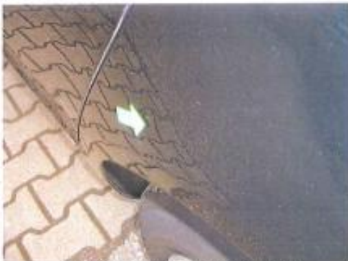
Delle Seitenwand hinten links