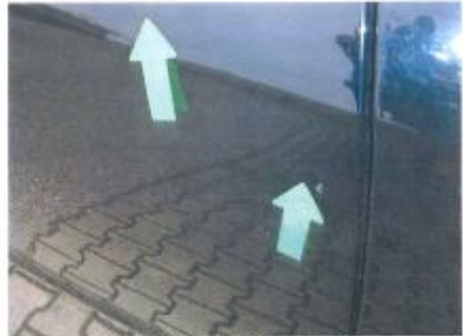
Delle Türe hinten rechts