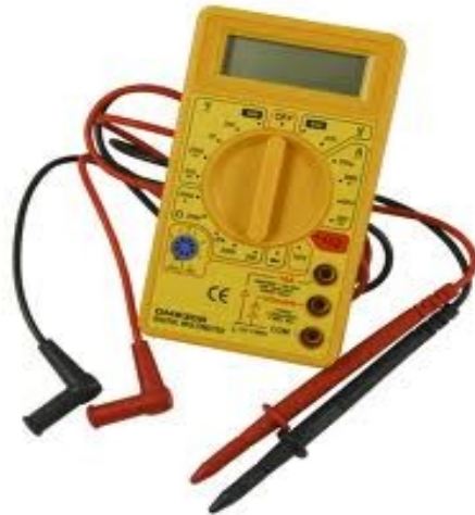
Multimeter, ca. 10€