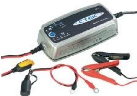
Ladegerät mit Erhaltungsladung