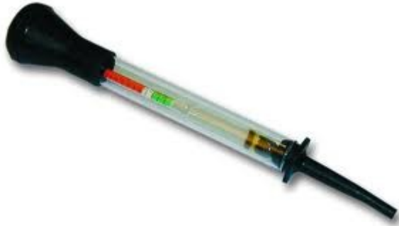
Batteriesäureprüfer, ca. 4€

Wer sich selber helfen möchte, sollte sich folgende Ausstattung zulegen: