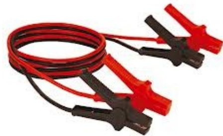
Starthilfekabel, ca. 15€