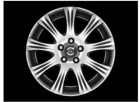
Cassini 7,0 x 17"