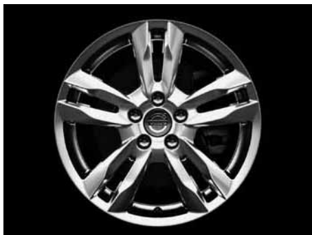
Njord 8,0 x 17"