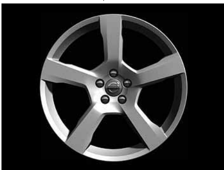
Cratus 8,0 x 18"