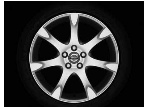
Fortuna 8,0 x 18"