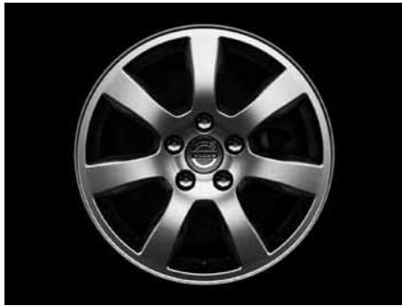
Oden 7,0 x 16"