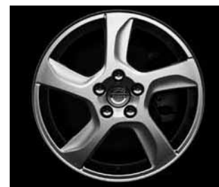
Balder 7,0 x 17"