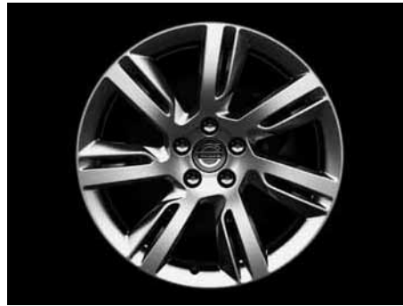
Sleipner 8,0 x 18"