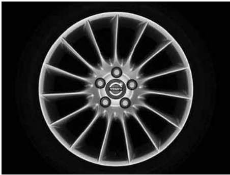
Balius 8,0 x 18"