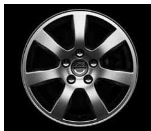
Oden 7,0 x 16"