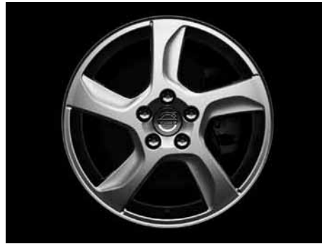
Balder 7,0 x 17"