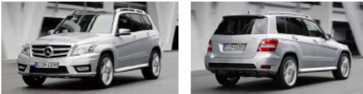
GLK-Klasse (Typ 204)