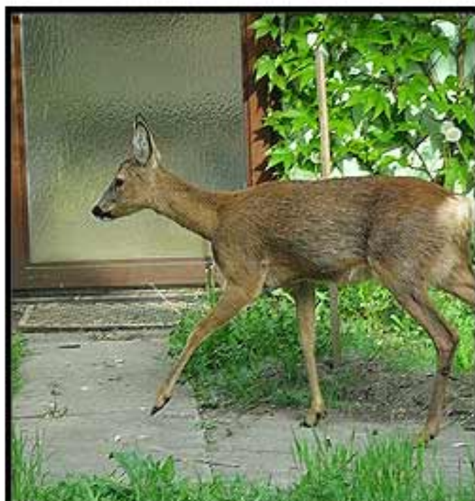
Reh vorm Haus