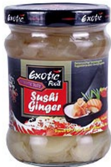
Sushi im Glas