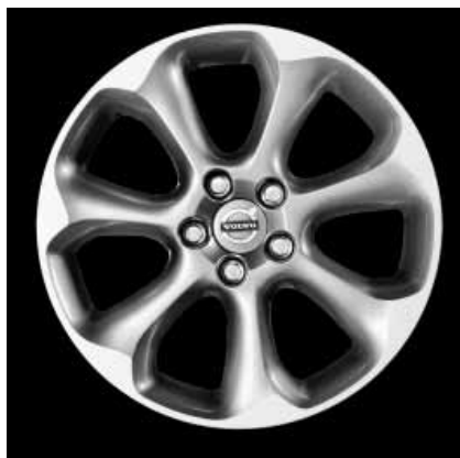
Pontos Silber Stone mit Diamantschliff 7,0 x 17"

2) Nur in Verbindung mit Außenfarbe Electric Silber-Metallic