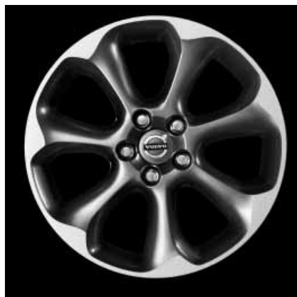
Pontos Hellgrau mit Diamantschliff 7,0 x 17"