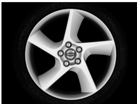
Odysseus 8,0 x 18"