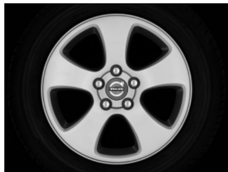
Creon 7,0 x 16"