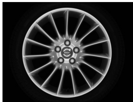
Balius 8,0 x 18"