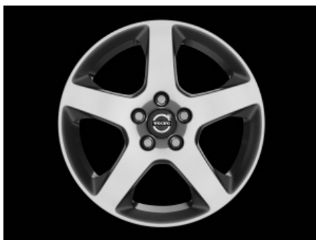
Canicula 7,0 x 17"