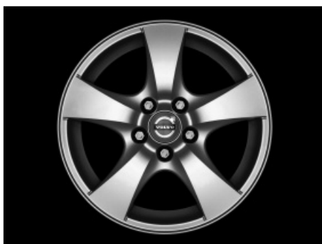
Atla 7,0 x 16"