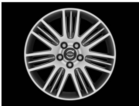
Meissa 8,0 x 17"