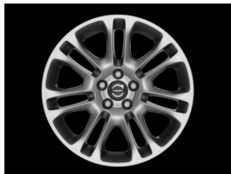
Zubra 8,0 x 18"