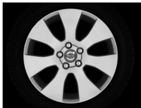
Spartes 7,0 x 17"