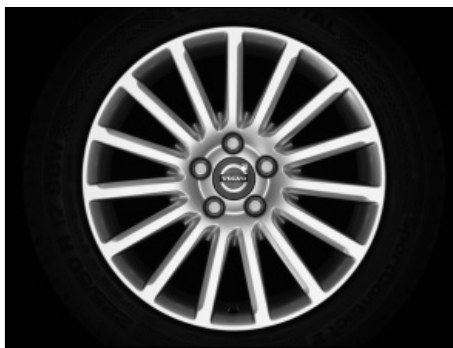
Regor 7,0 x 17"