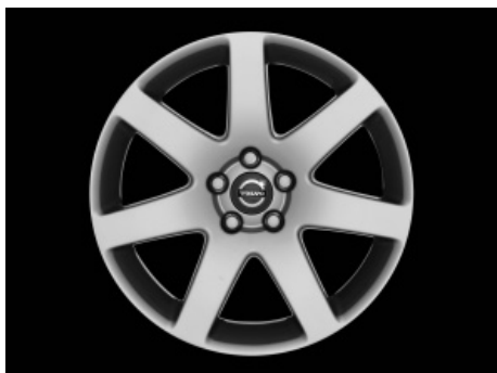
Venator 8,0 x 18"