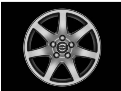
Naos 7,0 x 16"