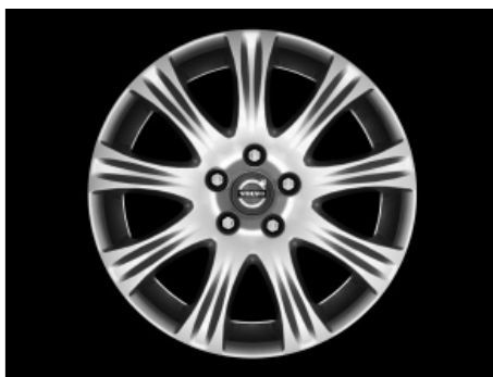
Cassini 7,0 x 17"