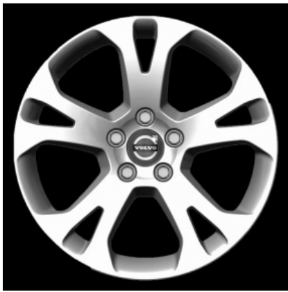
Talos 7,5 x 17"