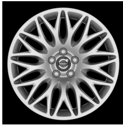
Eudora 8,0 x 18"