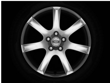
Syrma 7,5 x 17"