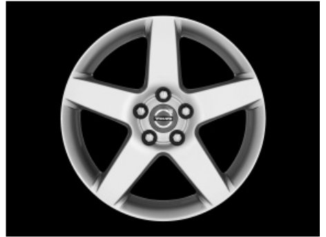
Serapis 7,5 x 17"