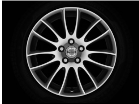
Sadira 7,5 x 17"