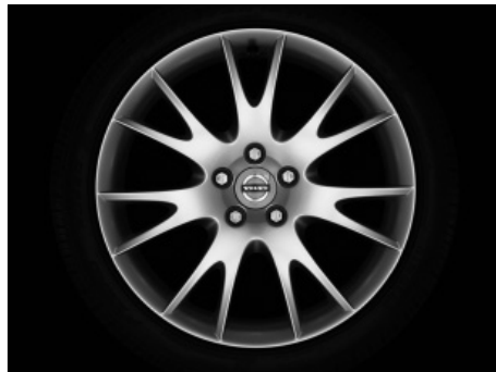
Mirzam 8,0 x 18"