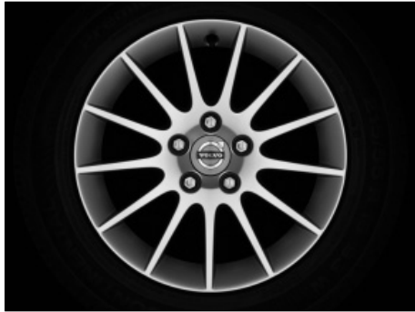
Castula 7,5 x 16"