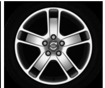
Zaurak 7,0 x 17"