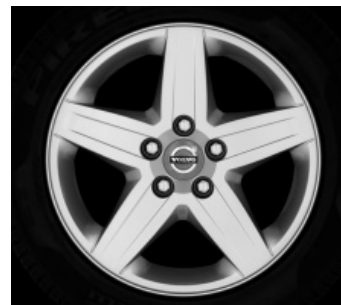
Ceryx 6,5 x 16"