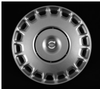
Stahlfelge mit Radzierblende

1) Nicht in Verbindung mit RDesign-Paket.