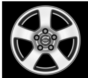
Isis 6,0 x 15"