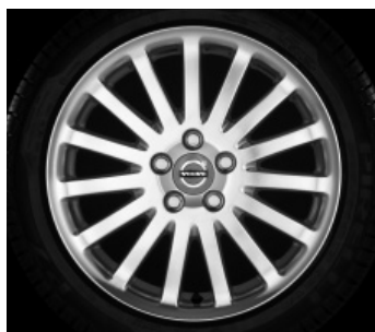
Scotia poliert 7,0 x 17"

3) Nicht in Verbindung mit Sportfahrwerk.