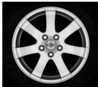
Cordelia 6,5 x 16"