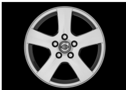
Tania 6,5 x 16"