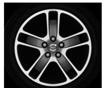
Zaurak Graphit/Silber 7,0 x 17"