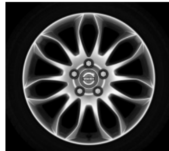
Mestra 7,0 x 17"