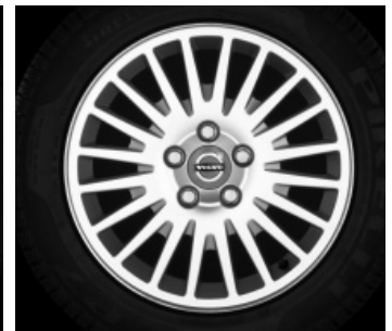
Crius 6,5 x 16"