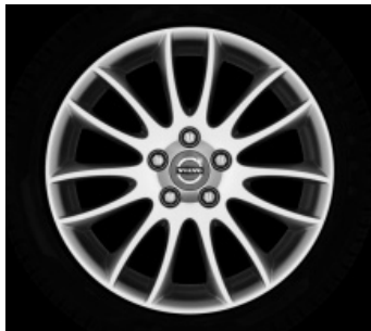
Spartacus 7,0 x 17"

2) Nur in Verbindung mit R Design-Paket.