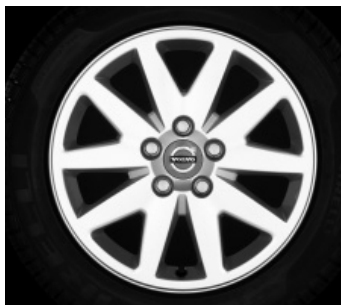
Cursa 6,5 x 16"