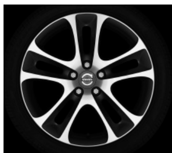
Atreus 7,5 x 18"