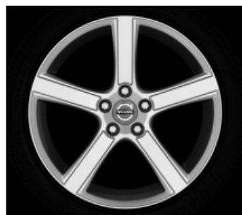
Midir 7,5 x 18"