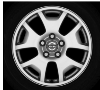
Celeus 6,5 x 16"