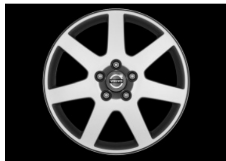
Stylla 7,0 x 17"