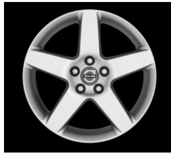
Serapis 7,0 x 17"