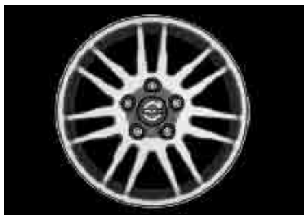
Acrux 6,0 x 15"