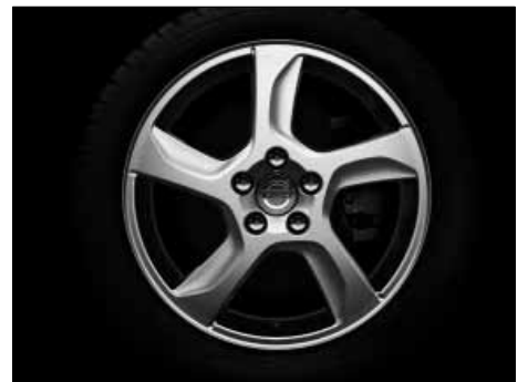
Balder 7,0 x 17"