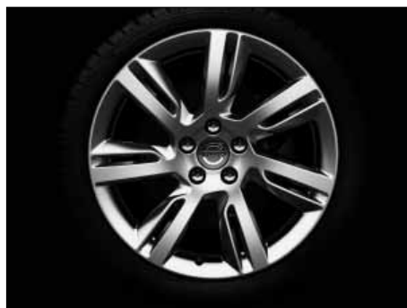
Sleipner 8,0 x 18"