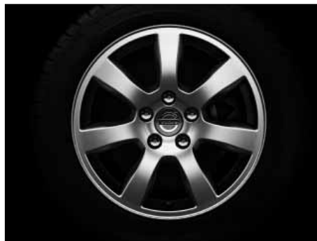
Oden 7,0 x 16"