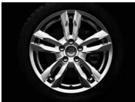
Njord 8,0 x 17"