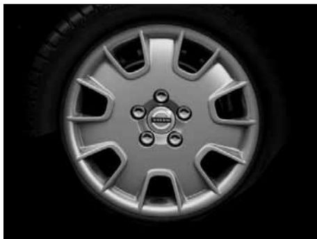
Stahlfelge 7,0 x 16"