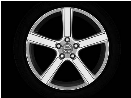
Midir 8,0 x 18"