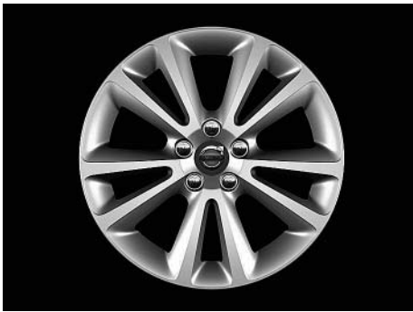
Sirona 7,5 x 17"