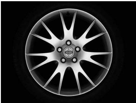
Mirzam 8,0 x 18"