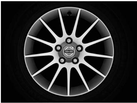
Castula 7,5 x 16"