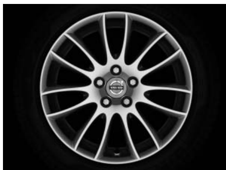
Sadira 7,5 x 17"