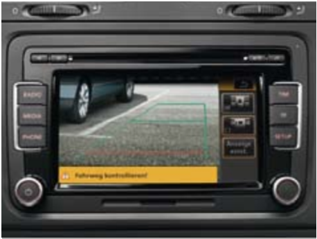
Abb. zeigt Radio-Navigationssystem „RNS 510“.

Auf dem Radiodisplay wird das elektronisch entzerrte Bild der Rückfahrkamera „Rear Assist“ in der Heckklappe wiedergegeben. So haben Sie beim Einparken freie Sicht nach hinten.