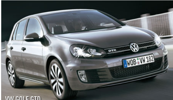
VW GOLF GTD

Front, Heck, Cockpit - nehmen Sie die neue Mercedes E-Klasse ganz genau unter die Lupe. In unserem interaktiven Showroom gibt es Feinheiten in Übergröße: autobild.de/mercedes