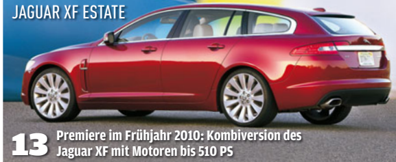
JAGUAR XF ESTATE

13 Premiere im Frühjahr 2010: Kombi-Version des Jaguar XF mit Motoren bis 510 PS