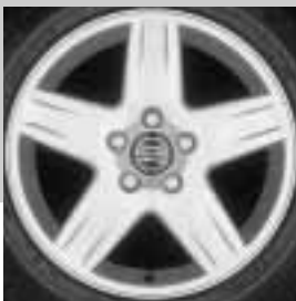
Sirius 7,0 x 16"