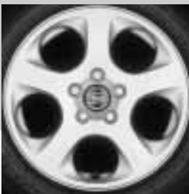
Canaveral 6,5 x 16"