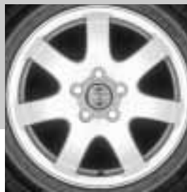
Orbit 6,5 x 16"