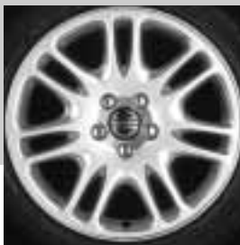
Amalthea 7,5 x 17"