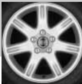
Mimas 6,5 x 16"