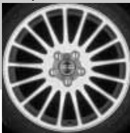
Tethys 7,5 x 17"