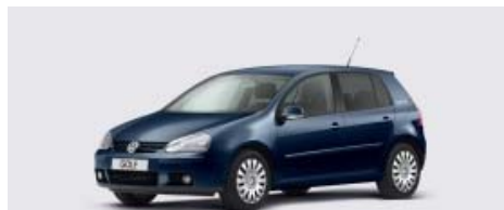
Außenlackierung Shadow Blue Metallic