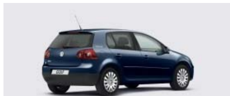
Außenlackierung Shadow Blue Metallic